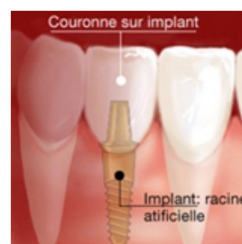
Couronne sur implant dentaire