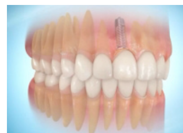
Prothèse dentaire terminée

Tout autant que la qualité, l'esthétique reste un souci constant du praticien