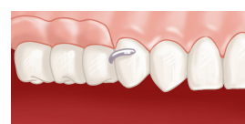
Prothèse en place